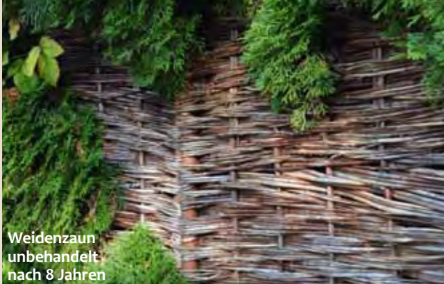
Weidenzaun unbehandelt nach 8 Jahren

Für die Herstellung unserer Naturzäune verwenden wir ausgesuchte, ungeschälte Weiden-, Haselnuss- und Robinienruten mit erstklassigen Eigenschaften in Stabilität und Farbgebung. Das hochwertige Flechtmaterial wird in Europa kultiviert und stammt aus nachhaltigem Anbau. Kleine osteuropäische Manufakturen fertigen unsere Naturzäune in reiner Handarbeit und ohne Chemie.